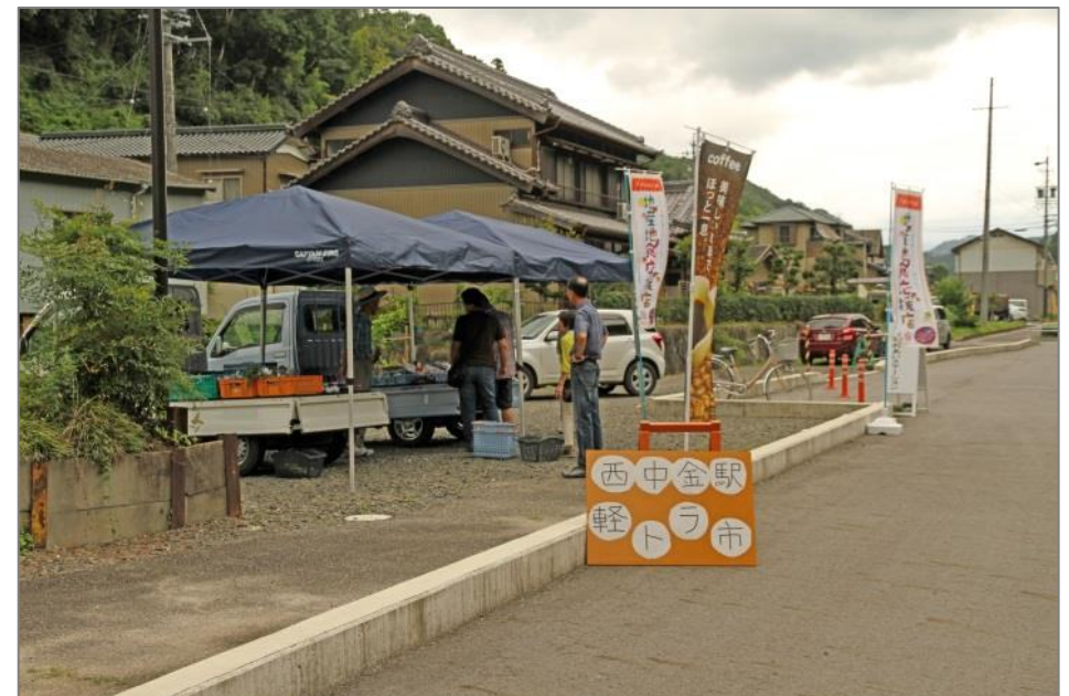
平成 28 年 8 月 27 日