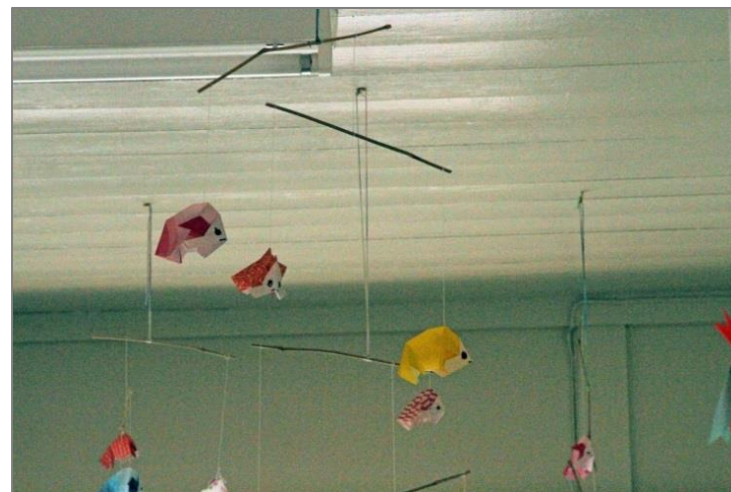
西中金ふれあいステーション内に色とりどりの魚たちが、スイスイと泳いで涼を呼んでいる。