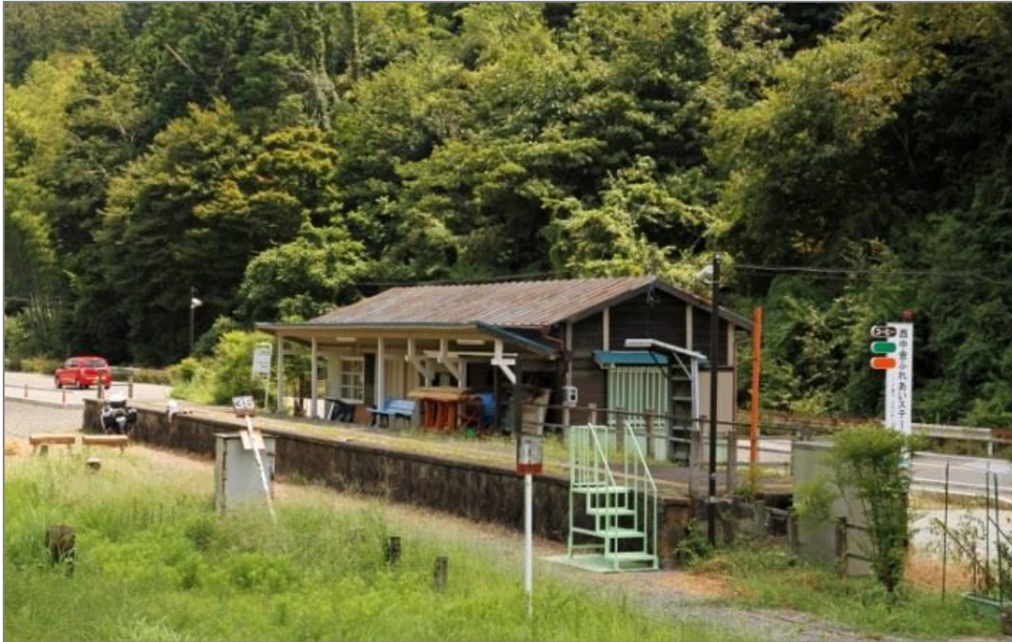
旧・線路とホームへの昇降する階段設置