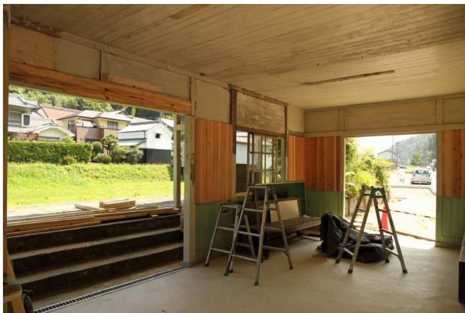
駅舎の内装工事…平成 27 年 8 月 5 日