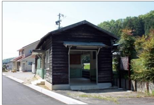
駅舎の案内看板…平成 27 年 4 月 27 日