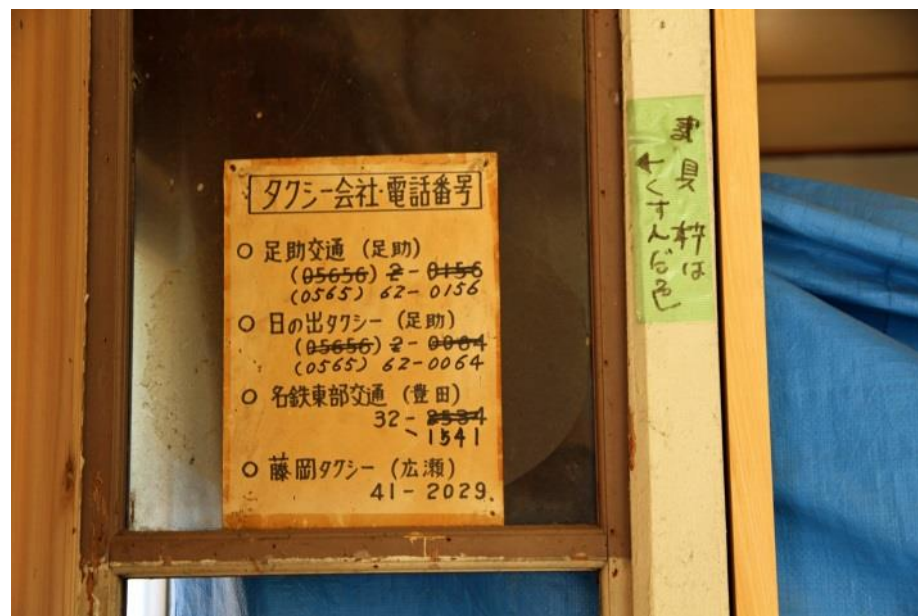
細かい指示の跡が…。「建具枠はくすんだ色」とか「天井は白色」等々