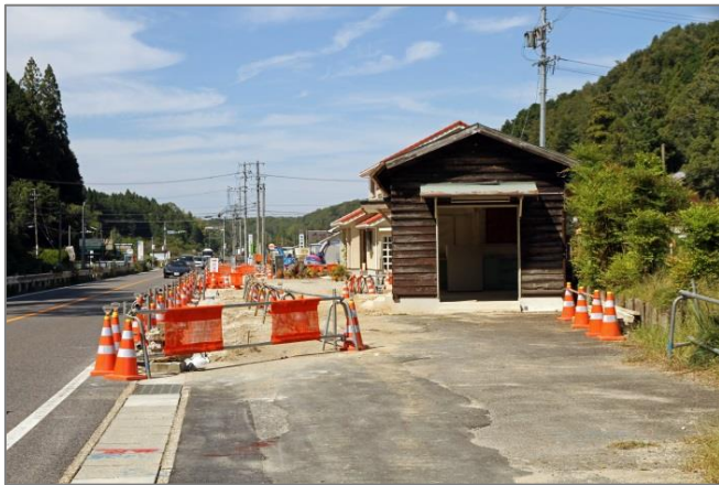
歩道新設工事中…平成 26 年 9 月 21 日