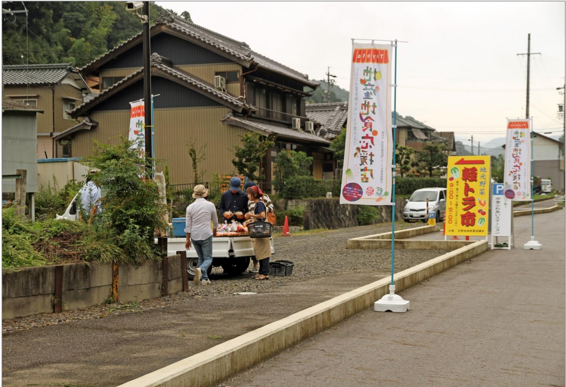
軽トラ市の看板が変更され目立つようになった …平成 28 年 9 月 24 日