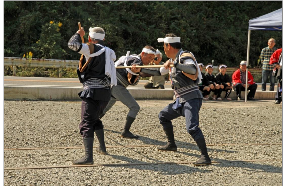
中切町「棒の手」保存会…5名が妙技を披露