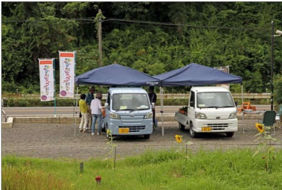
平成 28 年 7 月 23 日