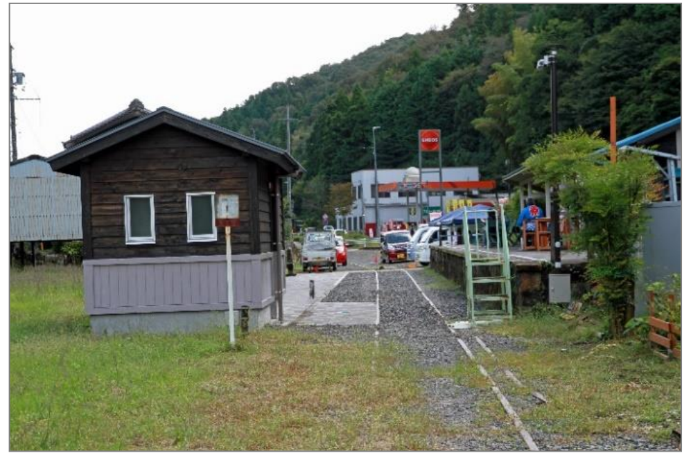
西中金…令和4年10月8日