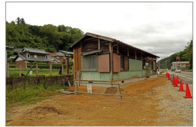
駅舎移設工事中(約 1600 mmホーム側に移設)…平成 26 年 8 月 3 日